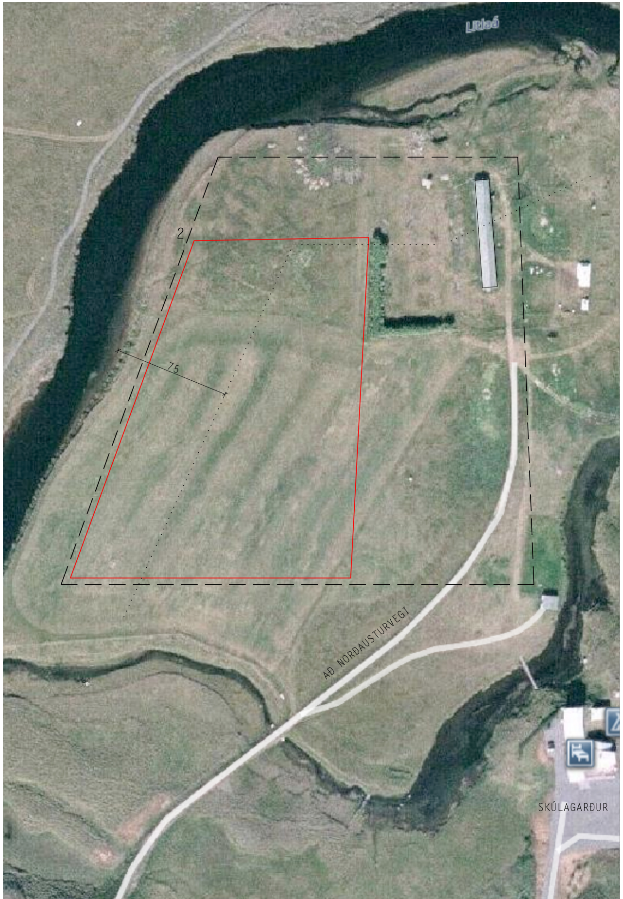
Tillaga að afmörkun svæðisins - svört brotalína. Fyrirhuguð lóð - heil rauð lína. Vatnsverndarlína (75 metrar) sýnd í svartri punktalínu