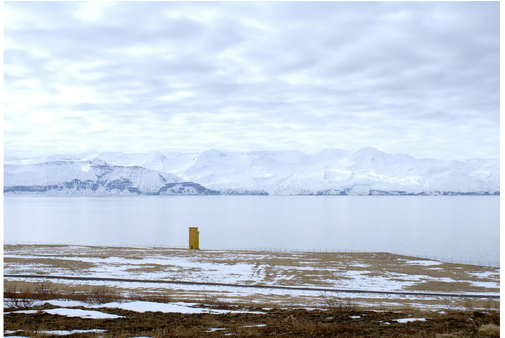
Mynd 4 Horft yfir svæðið til vesturs frá Húsavíkurhöfða.