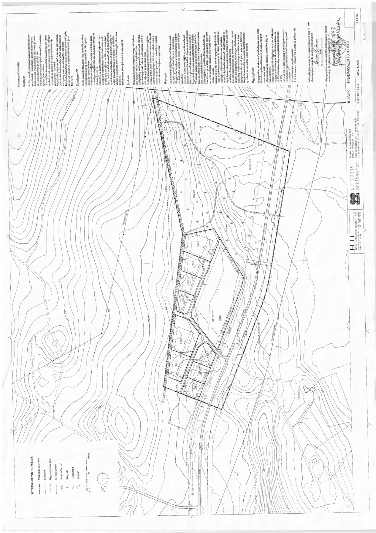
Mynd 1 Gildandi deiliskipulag frá 1997.