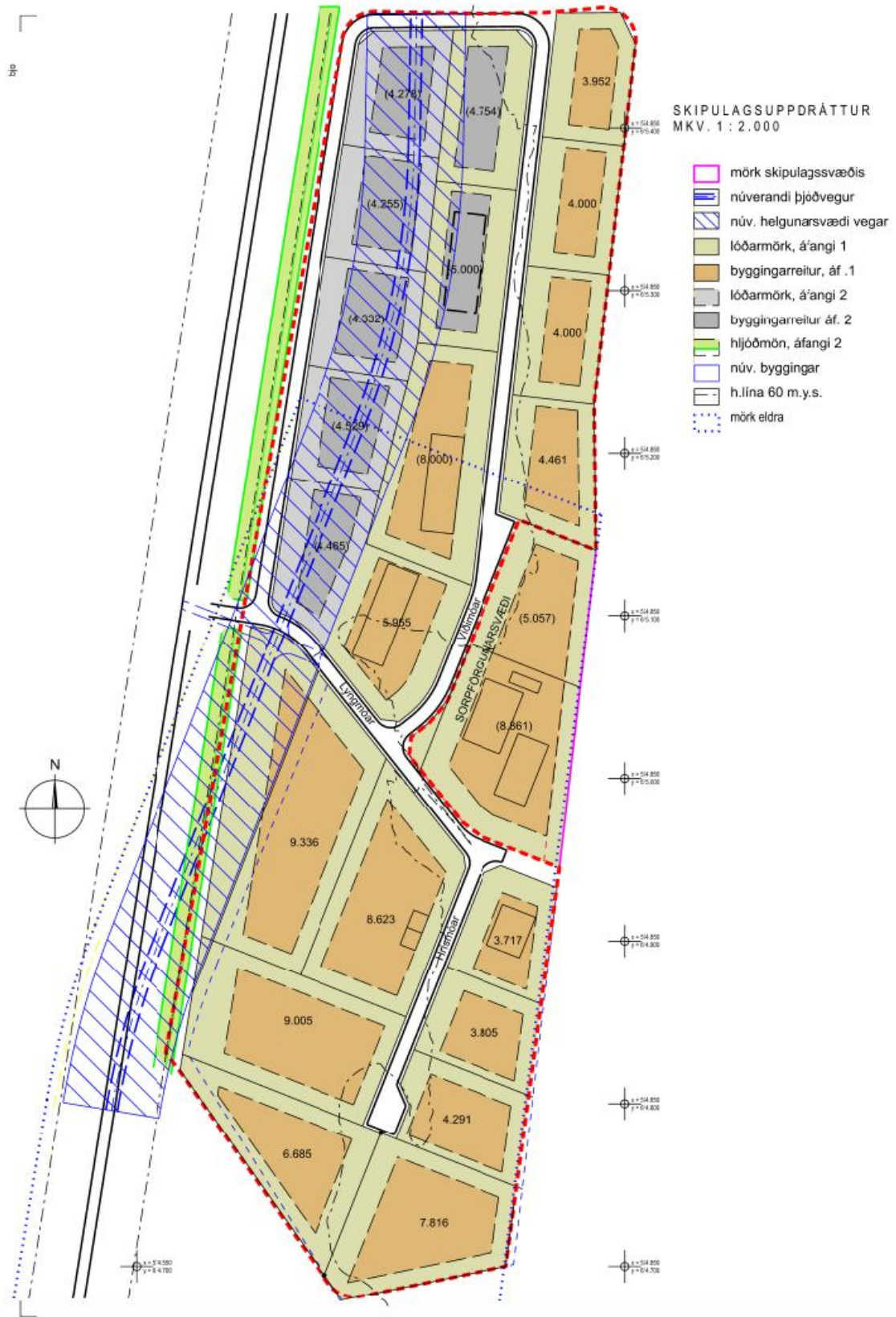
Mynd 3 Drög að deiliskipulagi svæðisins. Athugið að myndin er ekki í mæliskvarða.