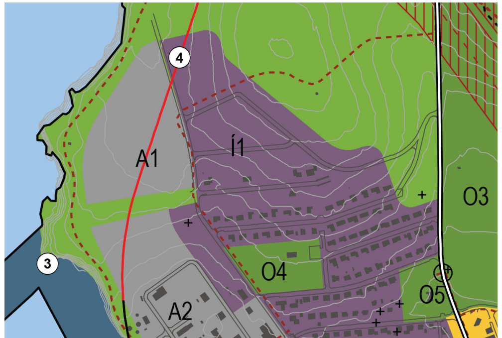
Mynd 2 Hluti gildandi Aðalskipulags Norðurþings 2010-2030