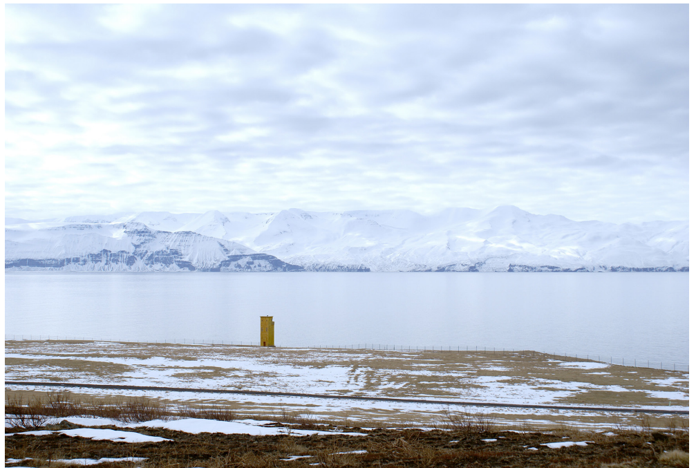
Mynd 3 Horft yfir svæðið til vesturs frá Húsavíkurhöfða.