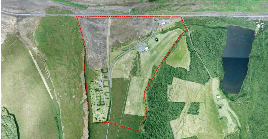
Afmörkun deiliskipulags frá 2004

Deiliskipulag Ásbyrgis. Samþykkt/Staðfest 05.07.2004. Verður fellt úr gildi. Mörk deiliskipulagsins eru dregin mjög þröngt og tekur aðeins til svæðisins fyrir minni Ásbyrgis austan við Eyjuna skammt norður fyrir þjóðveg og rétt suður fyrir tjaldsvæði. Það skilgreinir m.a. lóð fyrir Gljúfrastofu, hótellóð og íbúðarhúsalóð auk þess að sýna lóðir bygginga sem fyrir eru á svæðinu eins og verzlun. Sýnir viðbót við tjaldsvæði fyrir hjólhýsi.